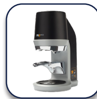
Coffema Tamper Puqpress Precisietamper