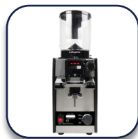
Coffema Slingshot S75/S68 Volume-meting espressomolen