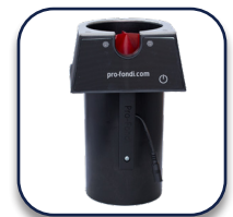
ProFondi Automatische filterdragerreiniger