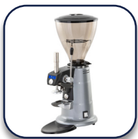
Coffema CXDT Grind-on-demand molen met geïntegreerde tamper