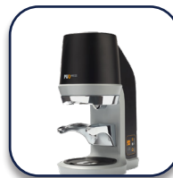
Coffema Tamper Puqpress Precisietamper