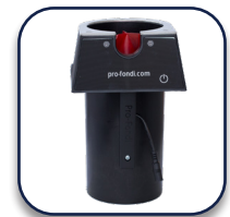
ProFondi Automatische filterdragerreiniger