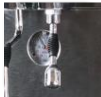
Heetwateruitloop met 2 doseringen