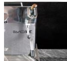
Twee coldtouch stoompijpjes