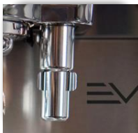
Eén cappuccinatoren voor bereiding latte macchiato, cappuccino of Cafe Latte