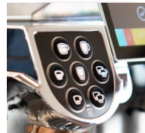
7 vrij programmeerbare producttoetsen per zetgroep